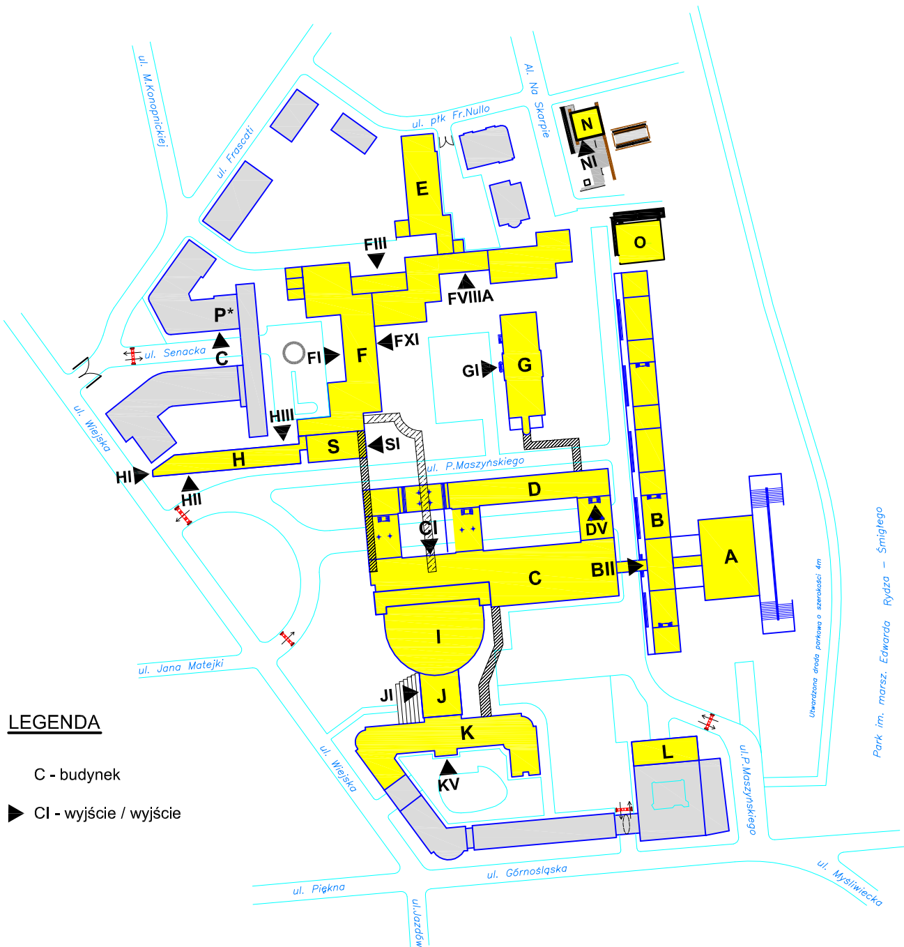
Budynki przy ul. Wiejskiej 4/6/8 i ul. Frascati 2

* budynek P pozostaje we współzarządzie Kancelarii Prezydenta RP, Kancelarii Sejmu i Kancelarii Senatu