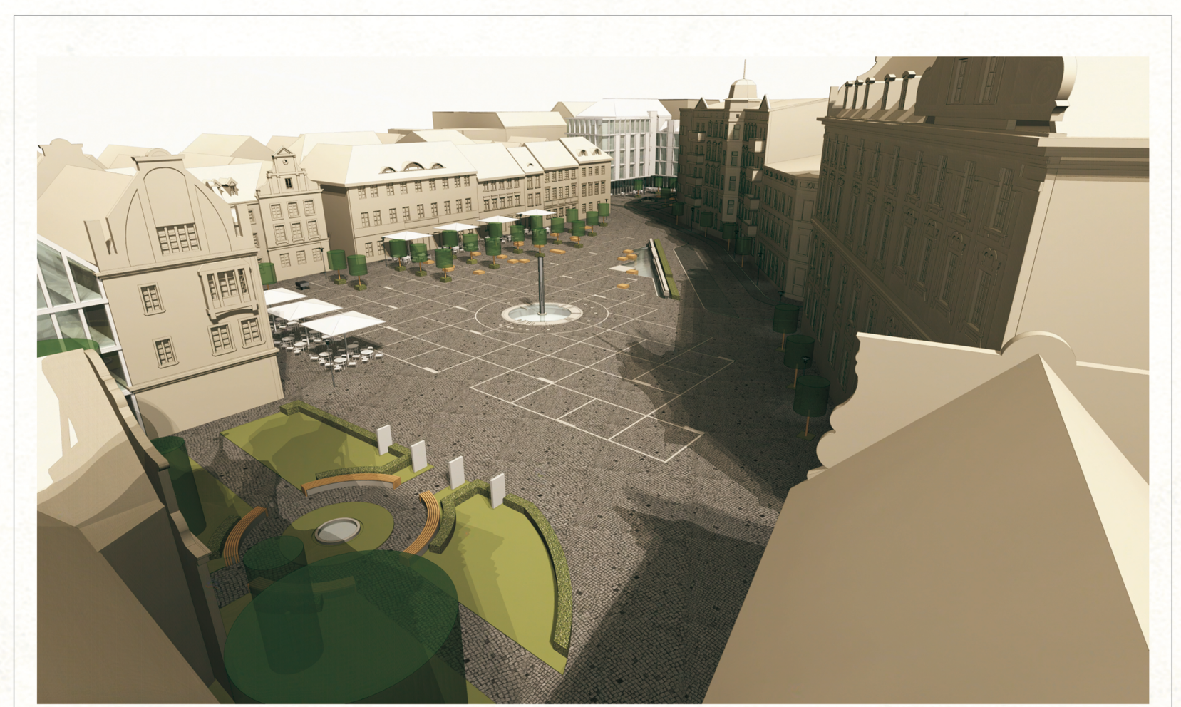
Zegar Historii, Kaskada Wodna, Szklane Ogrody, Ogród Sztuk