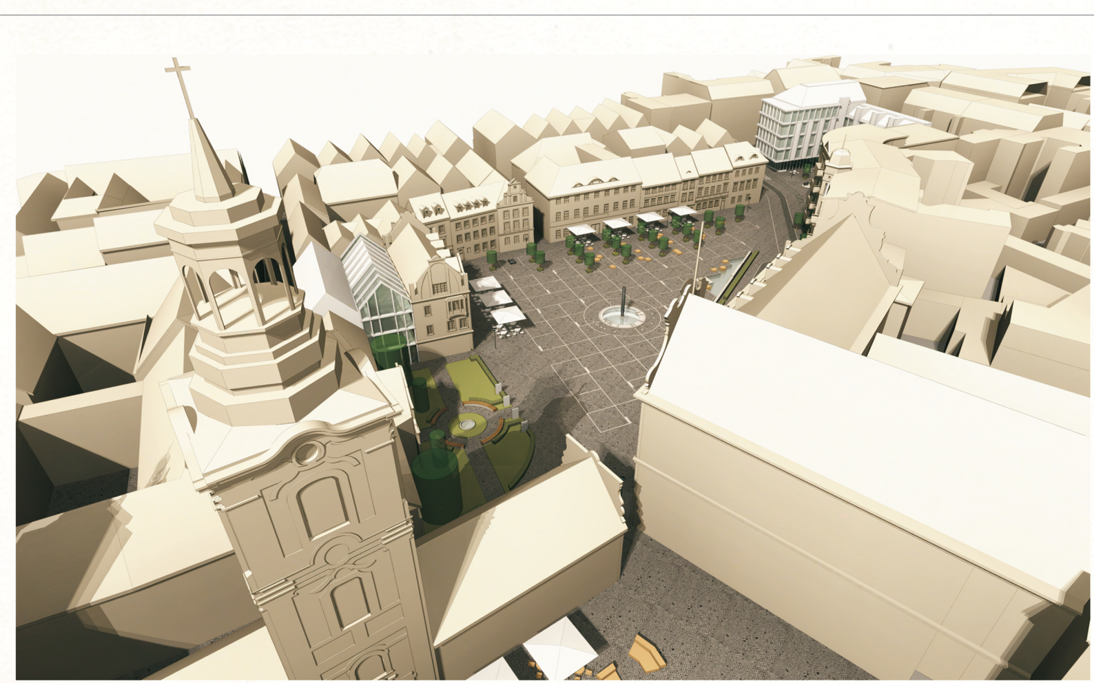
Ogrody Farne, Wejście do podziemnej trasy turystycznej, Scena plenerowa w Parku, Zielona widownia