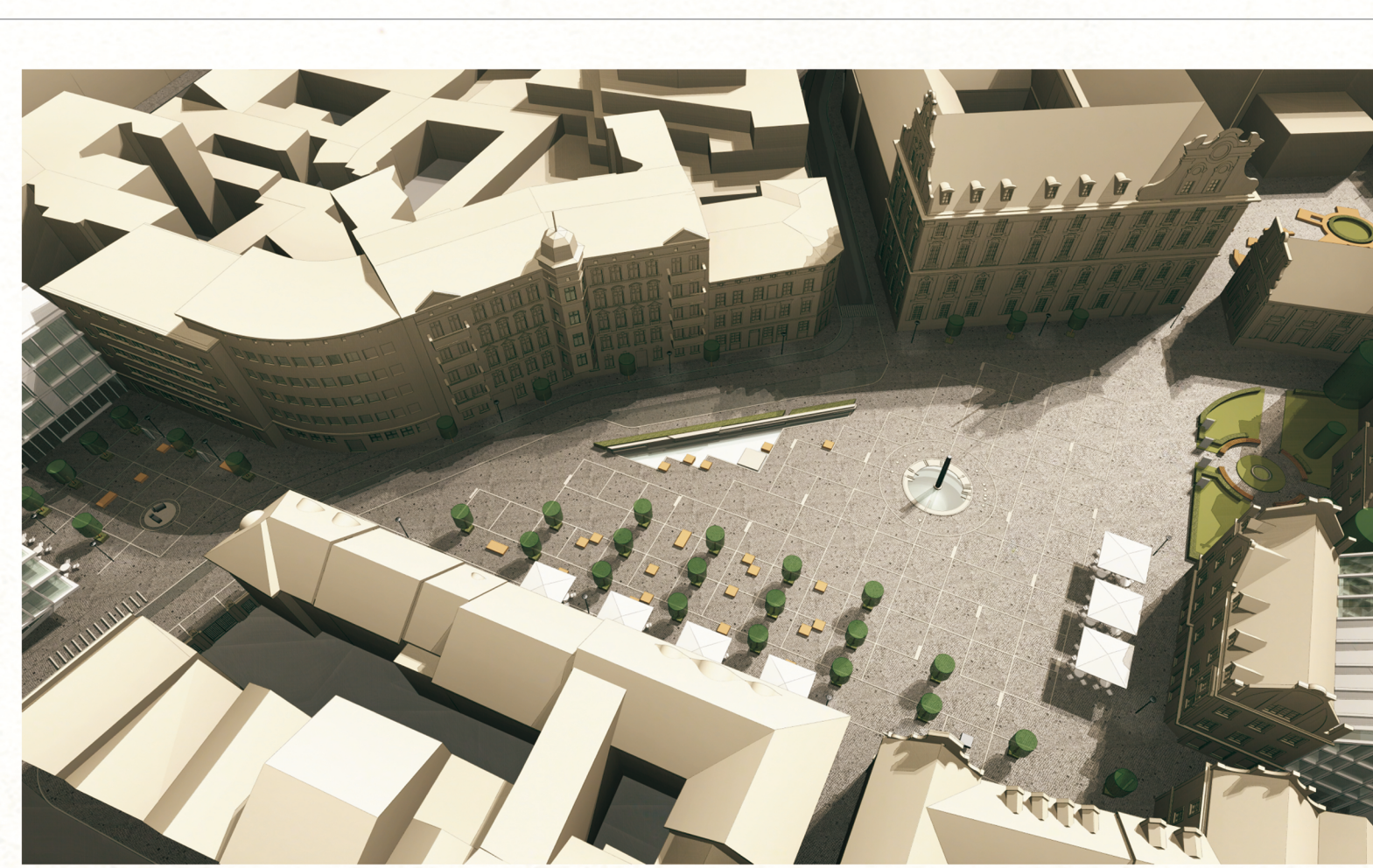
Zaulek Malarzy i Poetów