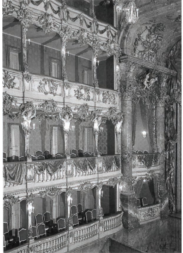
Ilustracja nr 1 .....