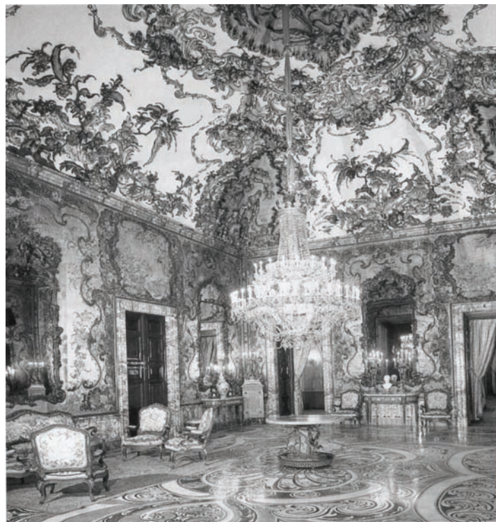
Ilustracja nr 3 .....